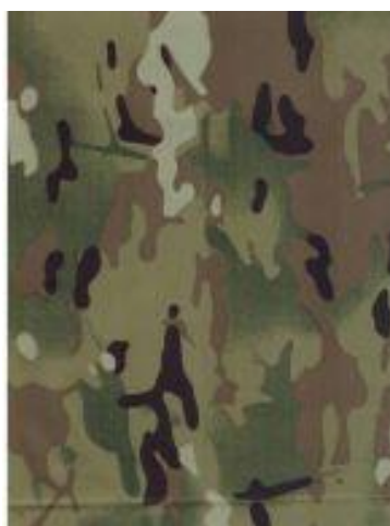
Мультикам Мультикам оригинал