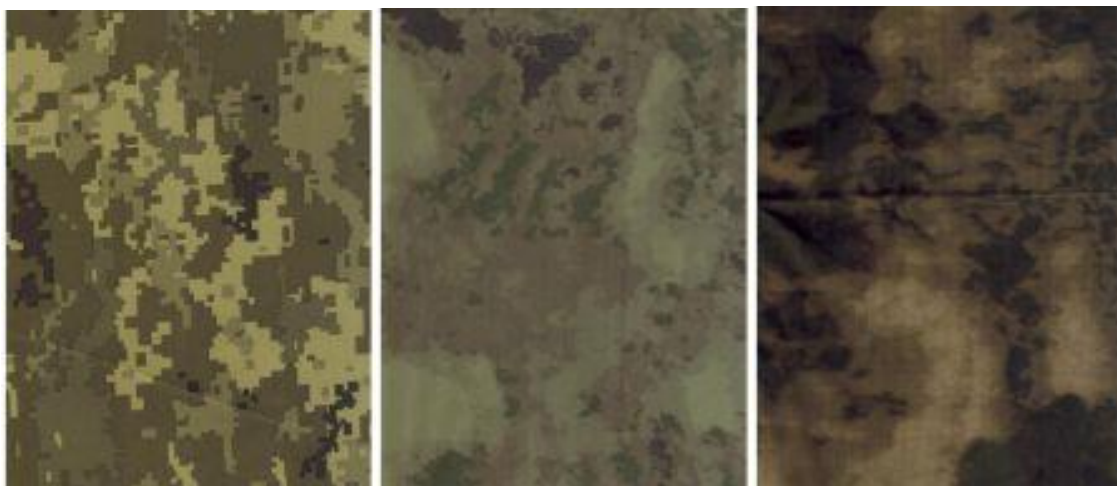
UKR.PIX (армейский, Порошенко)